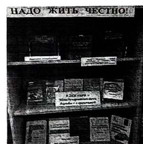
Сторителл Продвигать публикации Нравится 15 школа115кадет в рамках плана мероприятий "Коридоры жизни" и школьной библиотеки